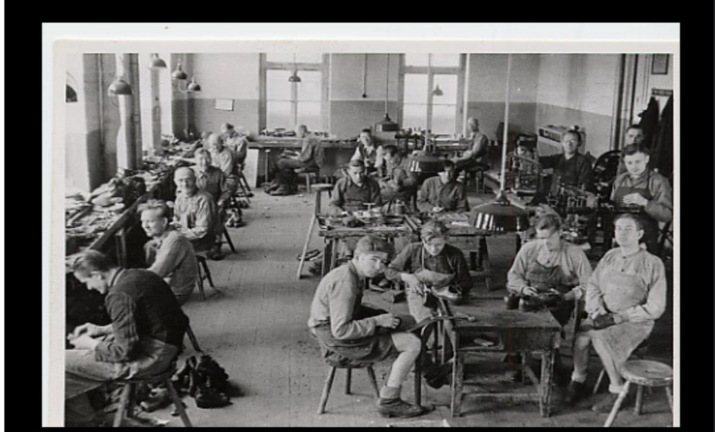
HAB F, 475