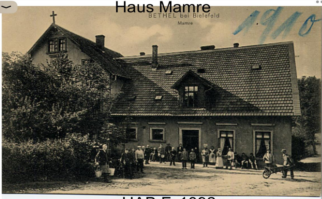
Haus Mamre BETHEL bei Bielefeld Mamre