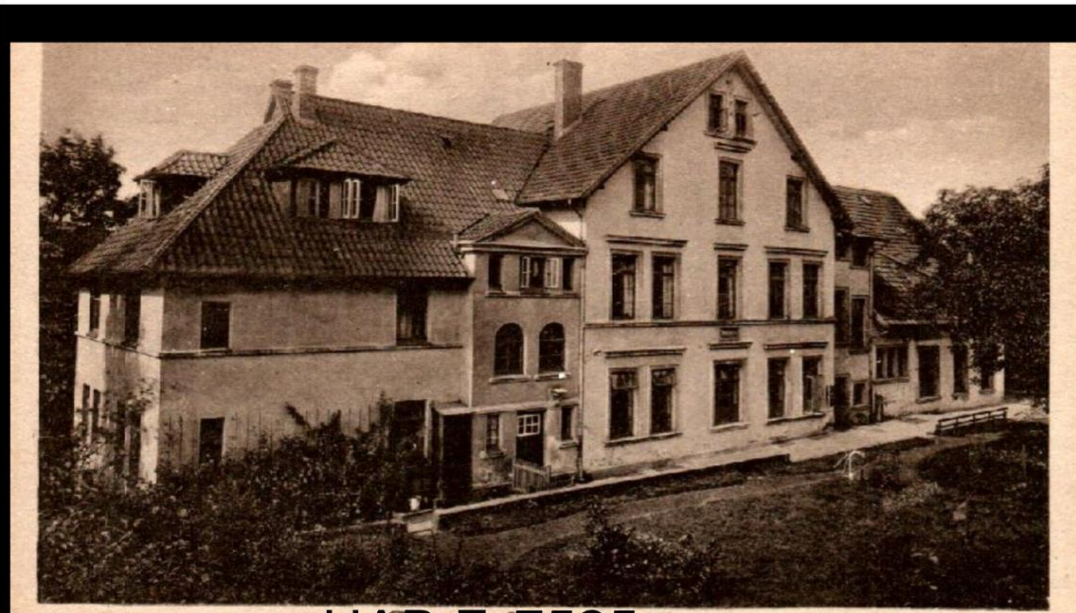
HAB F, 7525 Bethel bei Bielefeld Mamre